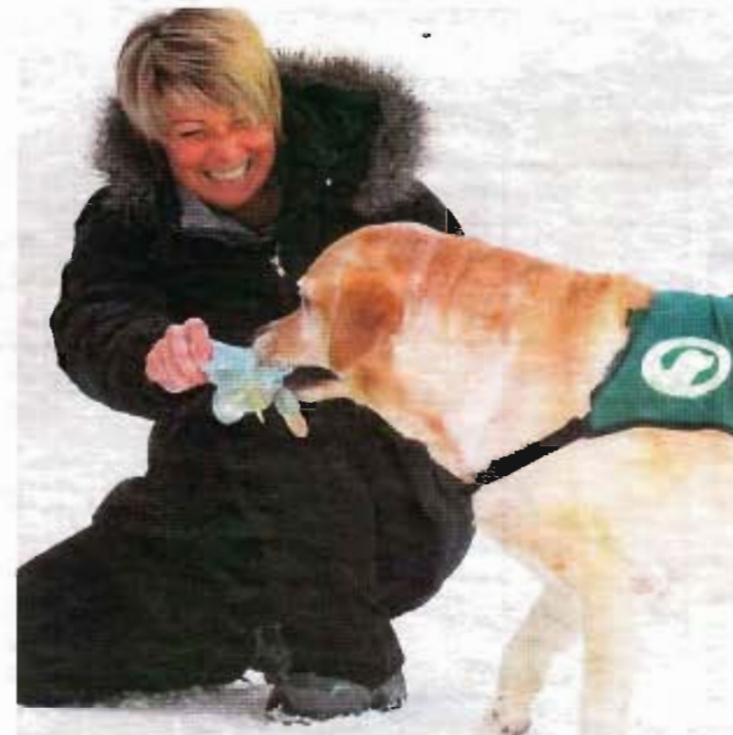
Die Hunde sind auch Fremden gegenüber sehr zutraulich.